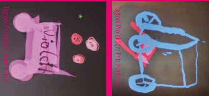
Tagtool Projektion: „Violet“