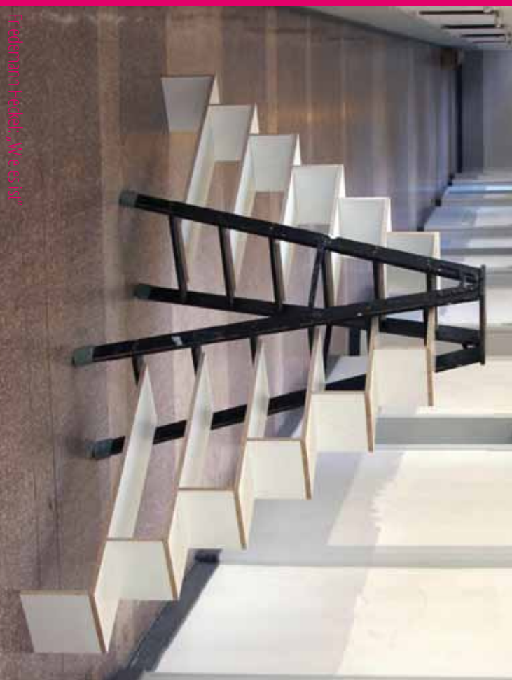
Ina Schüring: Eröffnung