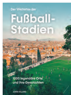
„Der Weltatlas der Fußball- Stadien“. Verlag Midas. 39 Euro.