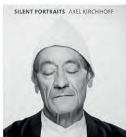
„Silent Portraits“. Axel Kirchoff. Verlag Seltmann. 59 Euro.